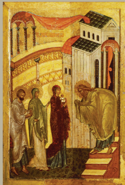
«Сретение». Третья четверть XV века Из церкви Успения на Волотовой почве